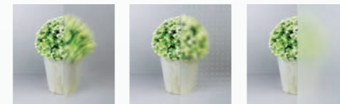
CHINCHILLA weiß MASTERCARRE weiß SATINATO weiß